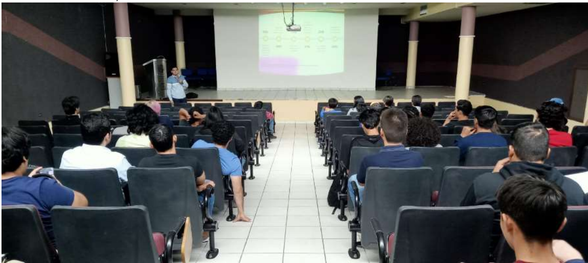
ANEXO 2.3. Foro 3, 30 de octubre del 2023.