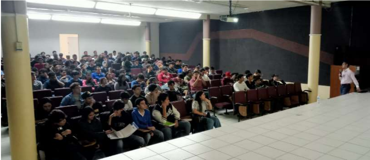
ANEXO 3. Votaciones, 01 de noviembre del 2023